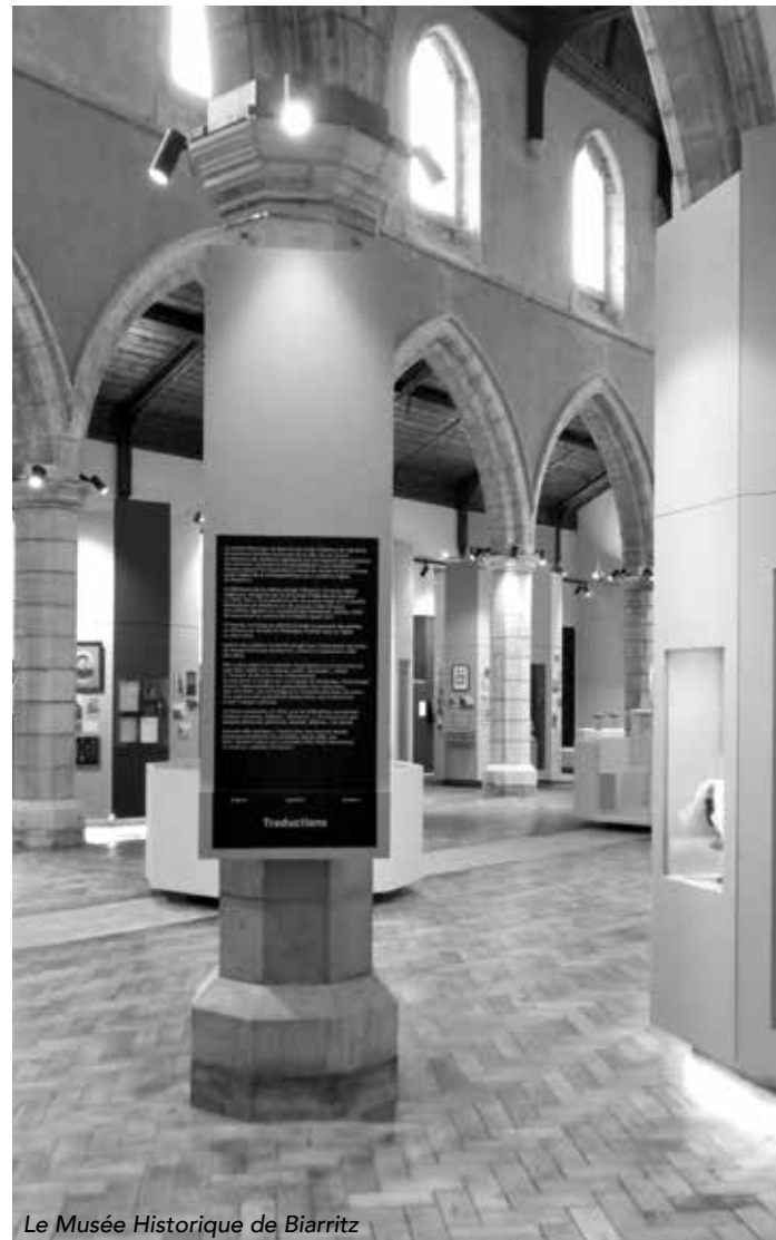
Le Musée Historique de Biarritz