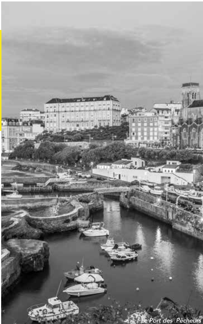
Le Port des Pêcheurs