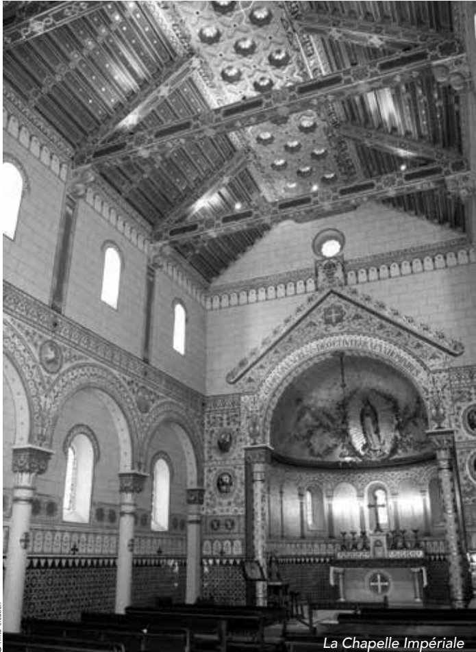
La Chapelle Impériale