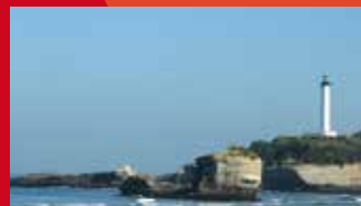
Phare de la Pointe Saint-Martin