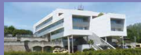
Direction régionale des ASF à Biarritz