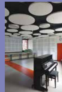
Maison de la Musique à Montardon

Créée par le CAUE 64 sur la base d'un travail de connaissance et de valorisation des réalisations architecturales locales des XX e et XXI e siècles, cette exposition présente une vingtaine de bâtiments et projets répartis sur l'ensemble du département. De la cabane d'estive, du foyer rural à la centrale hydroélectrique, une diversité de réalisations remarquables.