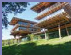
Quiksilver à St-Jean-de-Luz