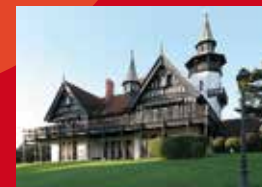
Domaine de Françon