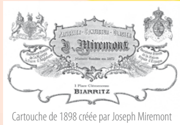
Cartouche de 1898 créée par Joseph Miremont

Eglise Saint Martin : AM du 12/01/1931 Château Boulard : AM du 29/10/1975 Hôtel Plaza : AR du 30/05/1990 Château d'Ibarritz (Bidart) : AR du 30/05/1990 Casino Municipal : AR du 07/10/1992 Hôtel du Palais : AR du 24/12/1993 Phare : AR du 06/11/2009 Monument aux morts : AR du 21/10/2014 Eglise Orthodoxe : AR du 11/05/2015 Pâtisserie Miremont : AR du 18/01/2006