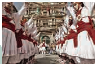
Infographie : exeal.06.14.11.29.13