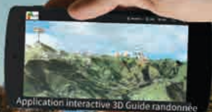
Application interactive 3D Guide randonnée